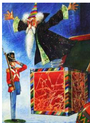
2. Г. Х. Андерсен. «Стойкий оловянный солдатик»