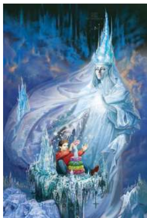
1. Г. Х. Андерсен. «Снежная королева»

А) Примеры иллюстраций сказок Г.Х. Андерсена 1 :