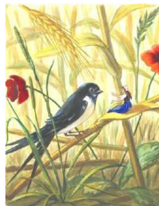
3. Г. Х. Андерсен. «Дюймовочка»