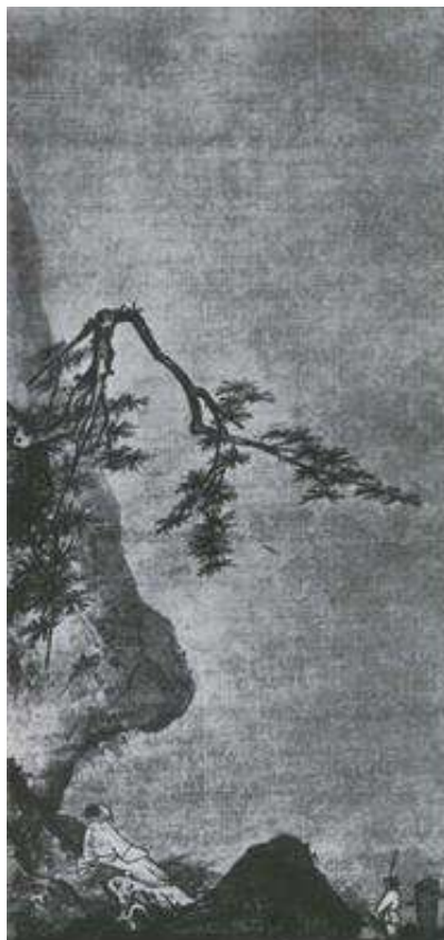
Ма Юань. Лунный свет.

2. Какими эмоциональными доминантами, по Вашему мнению, хотел наделять художник каждое произведение?