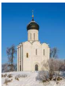
2. Храм Покрова Пресвятой Богородицы на Нерли