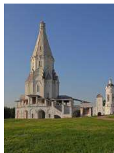
3. Церковь Вознесения Господня в Коломенском (Москва)