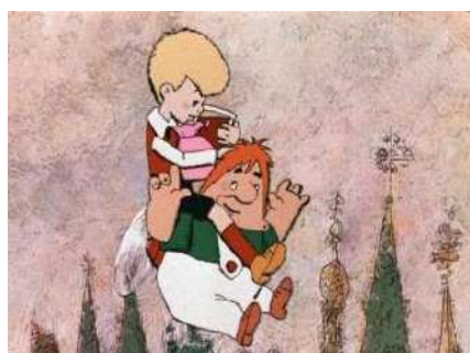
1. Астрид Линдгрен. «Малыш и Карлсон, который живет на крыше»