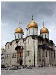
1. Успенский собор в Московском Кремле