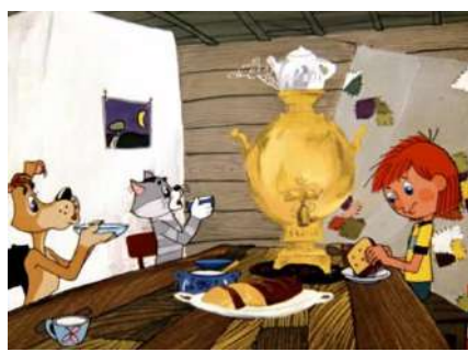
2. Эдуард Успенский. «Дядя Фёдор, пёс и кот»