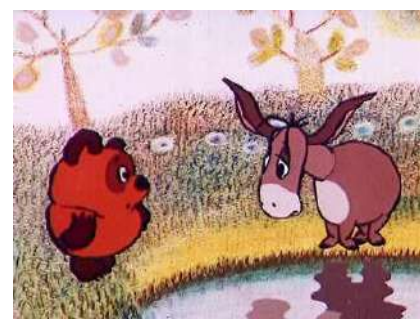
3. Алан Милн. «Винни-Пух и все-все-все»